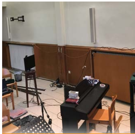
Oktober: Technische Erweiterung für den Videoraum (mittlerweile fertiggestellt)