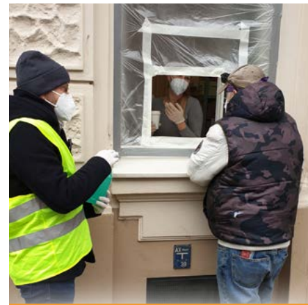
Dezember: Beginn der Essensausgabe für Obdachlose und Bedürftige. Wegen Corona im Freien ...

Kirche und Videoraum Aktive Mitfeier mit Bild und Ton oder anonyme Mitfeier, um „reinzuschneppen“: Beim Videoraum handelt es sich um keinen Live-Stream, sondern um ein Video-Konferenz-System, das wir in der Kirche fix installiert haben. Alle Gottesdienste und Veranstaltungen in der Kirche feiern wir zeitgleich auch im Videoraum. Einige Gottesdienste (wie das Taizé-Gebet) und Veranstaltungen (wie das Bibellesen) finden – bequem von Zuhause aus – nur im Videoraum statt. Die Übersicht im Innenteil gibt darüber Auskunft. Eine ausführliche Anleitung zur Mitfeier über unseren Videoraum finden Sie auf unserer Homepage: wien15.altkatholiken.at/video-raum